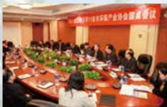
全国省际环保行业组织经济技术协作会