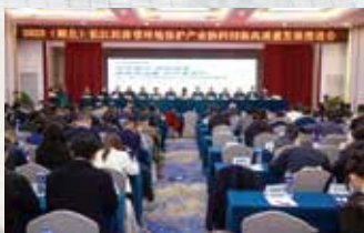
长江生态环境保护与高质量发展大会（主题峰会）