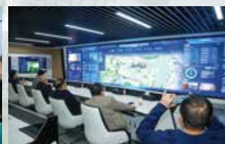
首届数智融合—智慧环保主题思创论坛