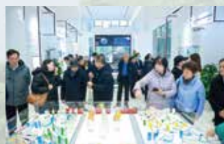
湖北节能产业暨绿色低碳发展大会